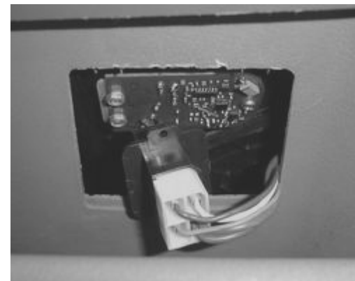
Рис. 3 Установка устройства.