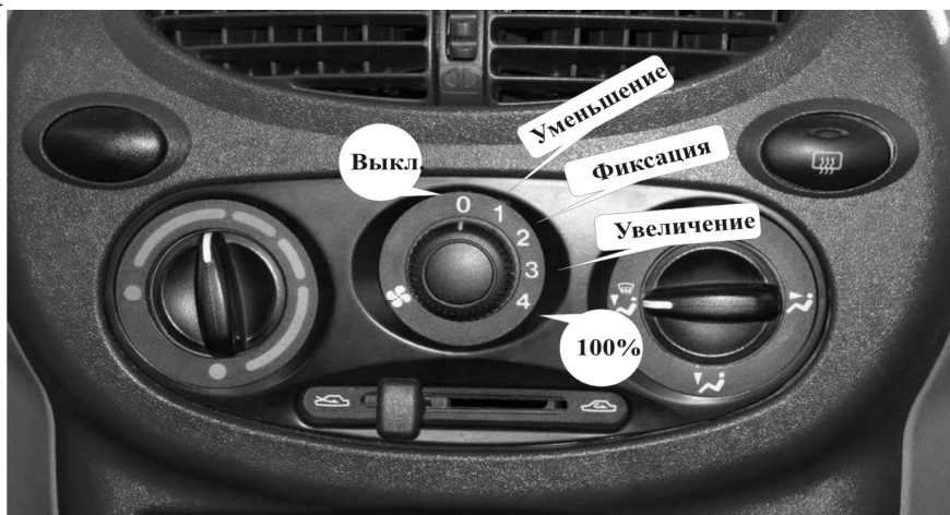
Рис. 2 Органы управления отопительной установкой LADA KALINA

2.12 В положении "0" переключателя регулятор "Аквилон" выключается и останавливает вращение ЭО.